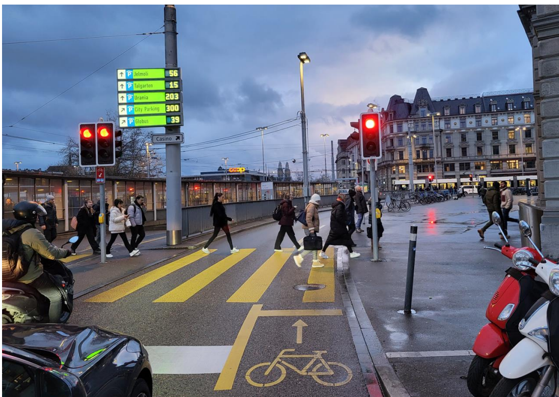
Bild 1: Anfahrt von Seite Landesmuseum, nach Rotlicht rechts auf Bahnhofvorplatz einbiegen